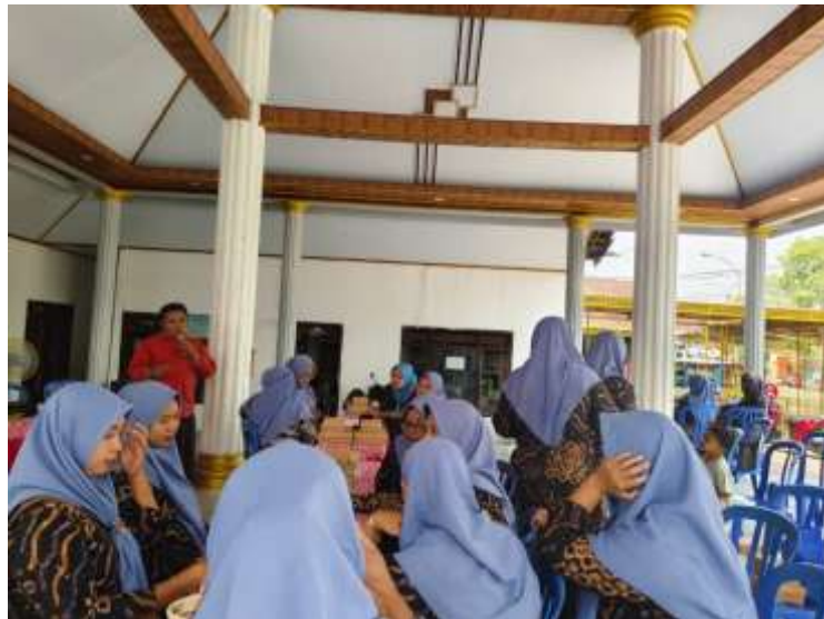
Gambar 1. Antusiasme wanita daam BumdesMa

Menariknya, aktivitas yang dijalankan tidak lepas dari dimensi lingkungan. Kegiatan seperti pengelolaan sampah, daur ulang, hingga pemanfaatan bahan sisa menunjukkan praktik nyata dari Green Economy sebagaimana dijelaskan oleh Edward B. Barbier. Artinya, apa yang dilakukan perempuan di tingkat desa sebenarnya telah merepresentasikan konsep global dalam bentuk yang lebih sederhana dan kontekstual. Interaksi yang terbangun dalam kegiatan bersama menciptakan rasa saling percaya dan kebersamaan. Dalam hal ini, apa yang terjadi dapat dibaca sebagai bentuk penguatan modal sosial sebagaimana dijelaskan oleh Robert D. Putnam.