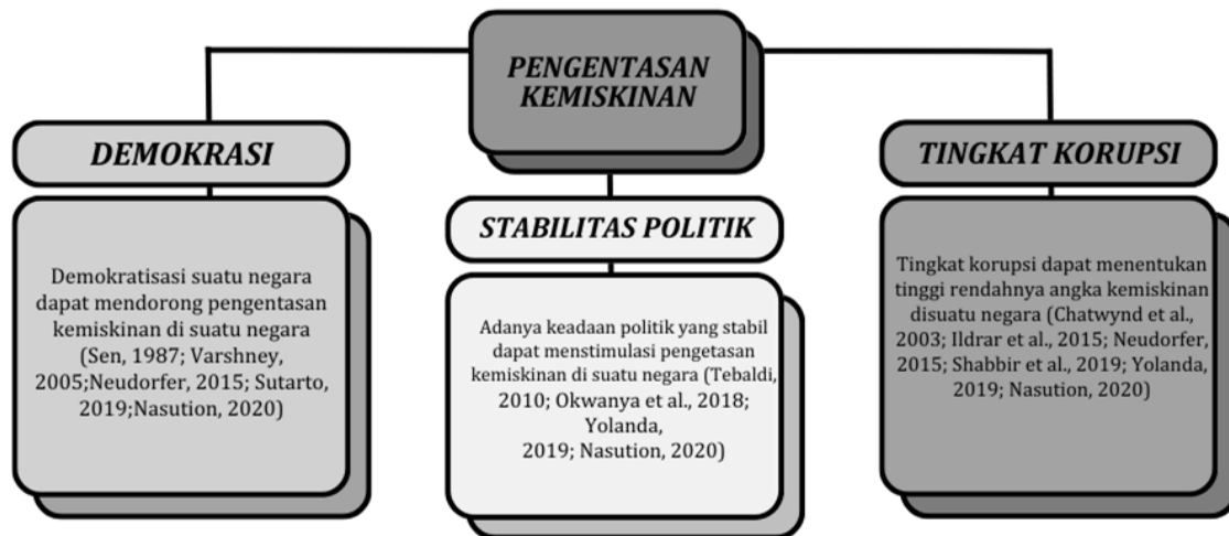
Gambar 2. State of the Art